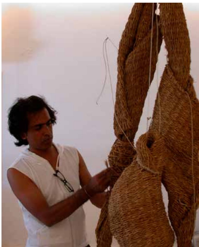
Omaggio a Gibellina, studio per una installazione. Scultura tessile, fondazione Orestiadi, Gibellina (Siracusa).

La mia ultima opera è realizzata con il tessuto del cotone di un sari indiano. Un materiale di tessuto di cotone riciclato che mi avvicina alla mia terra madre, alla mia memoria, alle mie tradizioni, alla mia eredità materna e culturale del telaio a mano. Dopo la mia lunga vita da immigrato ho ottenuto la cittadinanza italiana. Ora appartengo a una nuova identità. Allo stesso tempo, appartengo a un'altra identità che si basa sulla mia memoria e esperienza e non potendo tornare alla terra delle memorie d'infanzia e dell'odore del cotone dei sari e del terreno indiano, non mi resta che "aspettare" in altri luoghi del mondo. In Europa tesso le mie opere per simboleggiare due realtà diverse. Attraverso questa realtà provo a unire est e ovest con i miei limiti, le mie nostalgie e speranze.