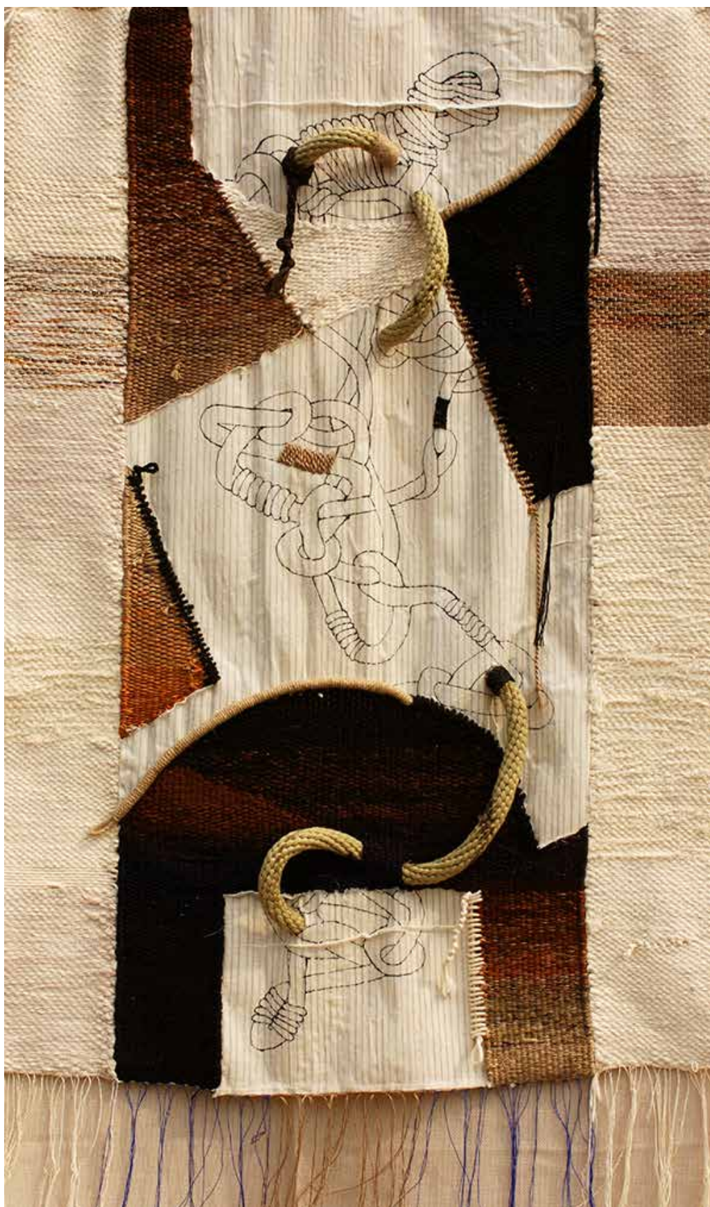
Foto 3 - Pagine di diario (pages of a diary), 2009, cotone, lana, materiali sintetici, fili di juta e corde, stoffa, 110x70 cm. Opera esposta per la prima volta in Italia presso la galleria Fiber art and.. di Milano. Copyright Shafiqul Kabir Chandan.