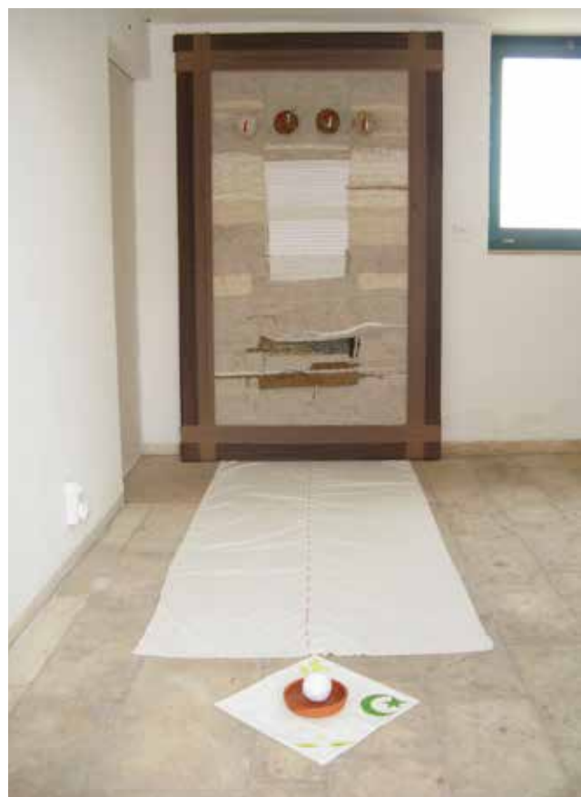
mostra LE 6 STAGIONI DI CHANDAN, fondazione Orestiadi, Gibellina (Siracusa).