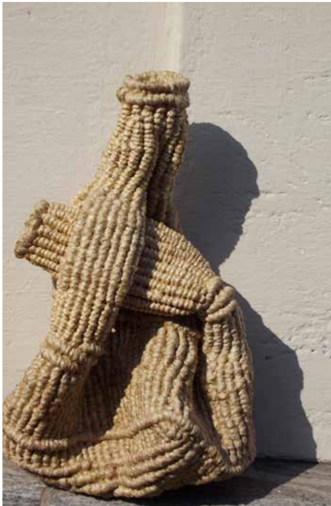
foto 2 - Brocca mitologica (Mythical pitcher) 2012, canap fibra con nodo di macramé, 26x18x14cm. Portabottiglie in corda intrecciata. Copyright Shafiqul Kabir Chandan.

intrecciandosi con le figure arcaiche di Henry Moore (foto 1) o rompendo la funzionalità di una brocca di canapa (foto 2), trapassando dal disegno su tessuto (foto 3) alle trame polimeriche di un vero e proprio quadro tessile (foto 4) ci troviamo di fronte a una intelligente manipolazione delle tecniche in funzione densamente estetica, nel senso di una esperienza tattile, sensibile del bello.