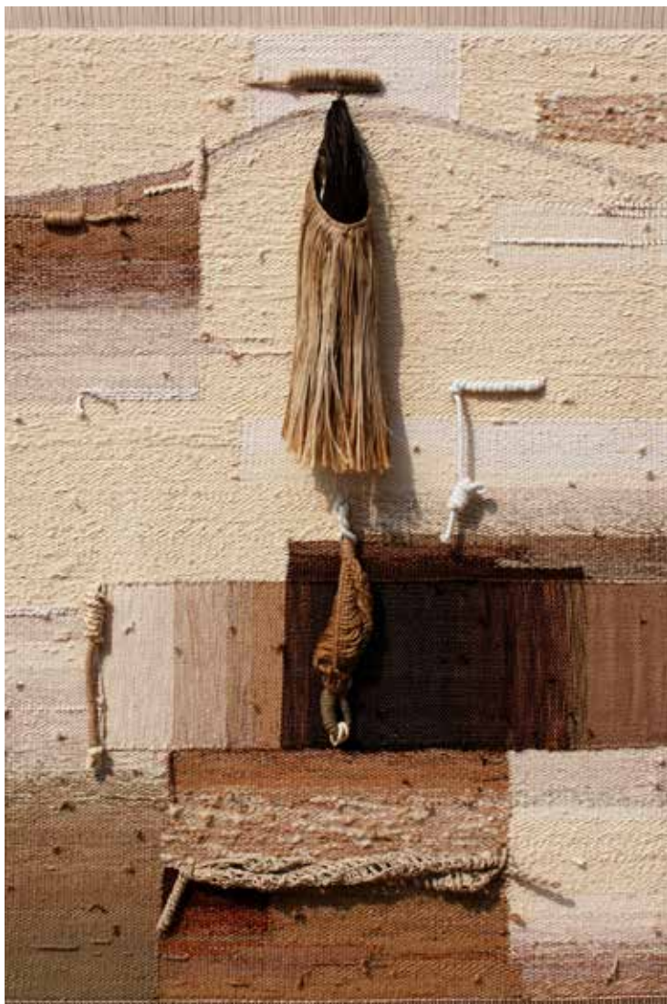
Foto 4 - Delicatezza di muri intrecciati (Grace of earthen hedge), 2009, cotone, lana, juta, fili sintetici e corde, stoffa, 135x110. Opera esposta per la prima volta in Italia presso la galleria Fiber art and.. di Milano.