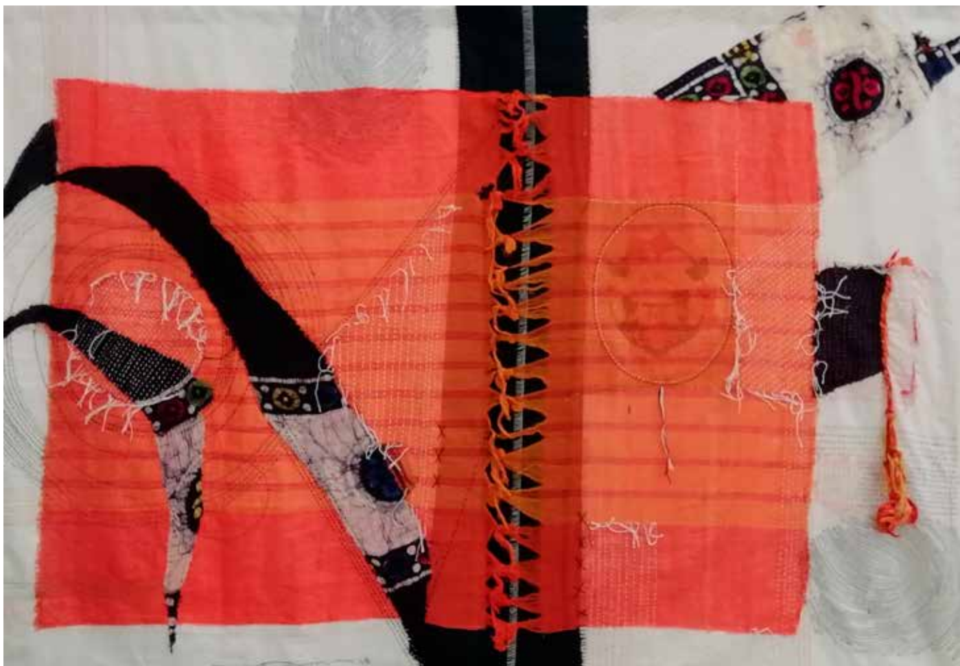
Memory, 2020 collage di stoffa 214 cm x 178 cm. Copyright Shafiqul Kabir Chan-